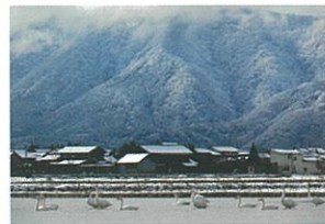
岩室温泉観光協会会長賞