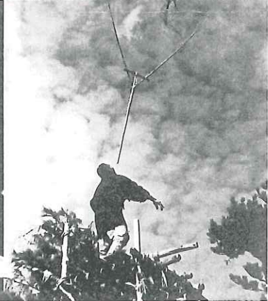
①鎧濁でスタテを使って鯉を獲る男性(昭和32年)／②鎧濁でのヒンの実取り(昭和33年)／③木島山からトロッコで砂を運ぶ(昭和35年)／④前季市に向かう多くの人が通る矢川橋(昭和32年)／⑤毒消し売り(昭和47年) ⑥深田の草取りから上がった農夫(昭和32年)／⑦入徳館小学校閉校の記念撮影(昭和53年)／⑧ハザ木が切られ蒲原平野が変わっていく／⑨土地改良によって区画整理された福井(昭和35年)／⑩巻原発反対のデモ隊 ⑪原発計画による用地買収の手紙を受けとった一人暮らしの老婆／⑫全国でも珍しいタカブ(小辮)の特産(昭和32年)